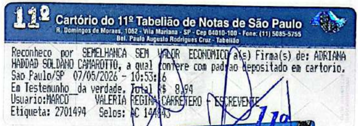
Felipe Legrazie Ezabella OAB/SP Nº 182.591